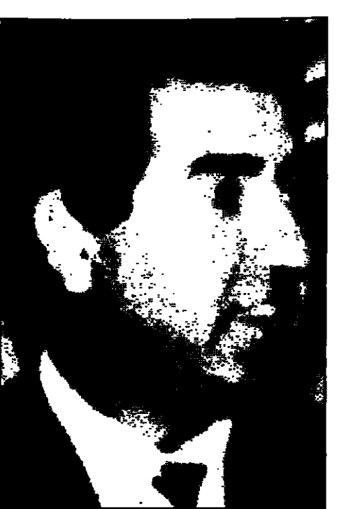
الطاهر بن يحيى الأمين العام للتحرك الوطني الديمقراطي